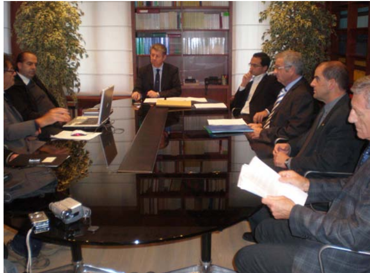
Momento de la Firma ante Notario.

En la Asamblea General de la Confederación estuvo presente Gianni Petrucci, Presidente del CONI (Comitato Olimpico Nazionale Italiano), mostrando todo el interés y apoyo.