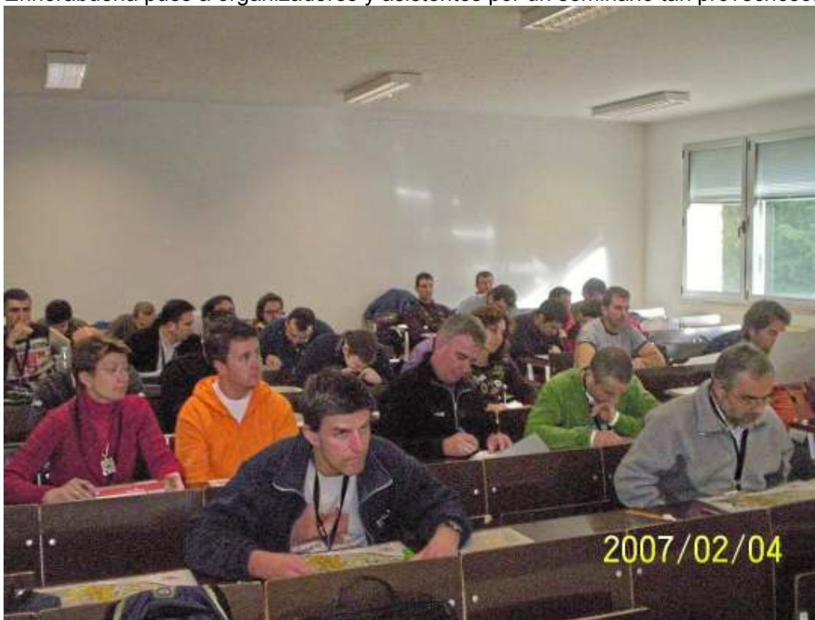
Los asistentes escuchan las consignas sobre las prácticas de trazado.

El seminario se evaluará con un trabajo proyecto de valoración de recorridos de una prueba de Liga Gallega o Liga Norte. Pero aparte de ello, se insistía en la necesidad de practicar y estar en contacto con la orientación, para diseñar y probar circuitos en pruebas locales, escolares, etc: sin práctica no hay progreso no aprendizaje real. Seguro que los asistentes seguirán la pauta y se aprestaran a empezar a trazar en carreras de promoción, locales e incluso regionales. Enhorabuena pues a organizadores y asistentes por un seminario tan provechoso.