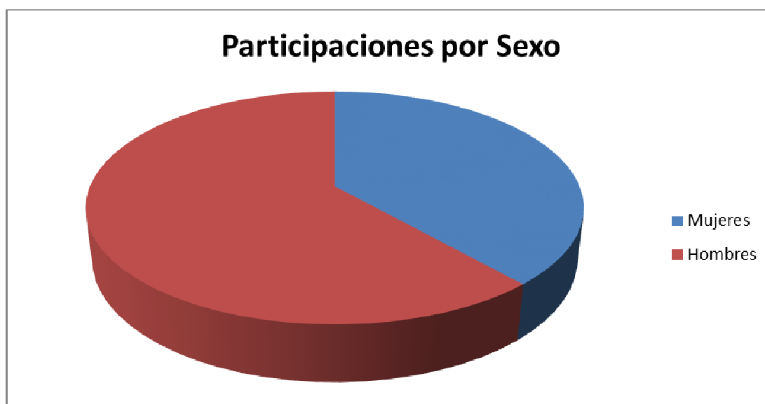
Figura 1. Participaciones por sexo LEO2016

De acuerdo a las condiciones definidas en el Anexo I, las 12 pruebas de la LEO2016 han tenido un total de 14856 participaciones, lo que supone un incremento del 7,71% con respecto a las 13452 participaciones del año 2015, y un incremento del 15,21% con respecto a las 12894 participaciones del año 2014. Por sexos, la distribución de participantes en 2016 se puede ver en la Figura 1.