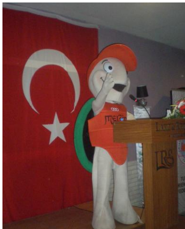
Mersin ocupó parte de la Reunión de la Comisión Ejecutiva

Vicepresidenta insistió en la necesidad de expansión de información a través de los medios de comunicación.