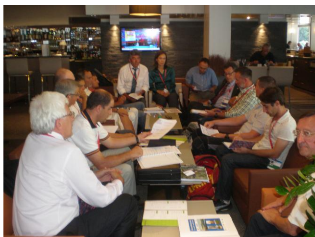
2do Council Meeting de la COMOF celebrado en Chambéry (Francia).

En la Asamblea además de los países miembros fueron invitados Bulgaria, Chipre, Francia y Croacia.