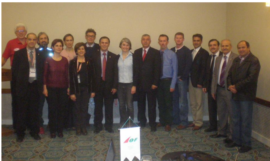
Foto de familia de la 5ª Comisión Ejecutiva de la COMOF