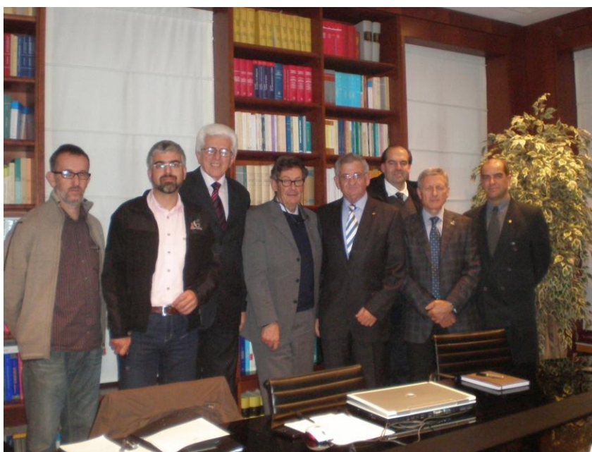
En la Notaria Foto de Familia: 13 Noviembre de 2010.