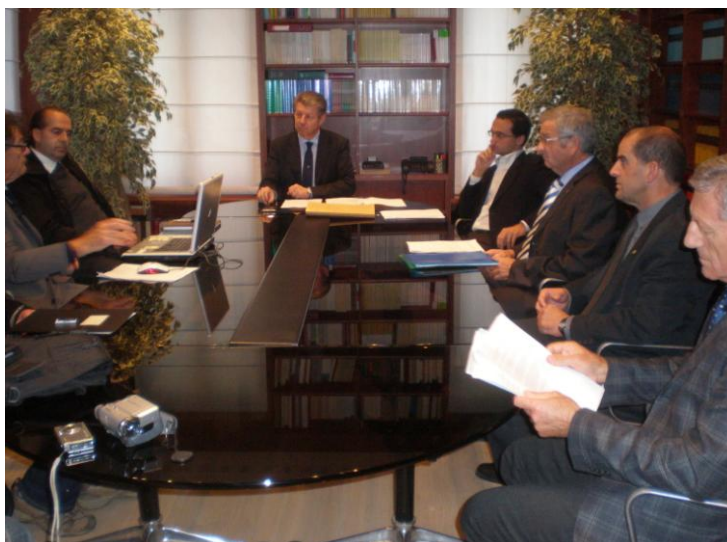
Momento de la Firma ante Notario.

En la Asamblea General de la COMOF estuvo presente Gianni Petrucci, Presidente del CONI (Comitato Olimpico Nazionale Italiano), mostrando todo el interés y apoyo.