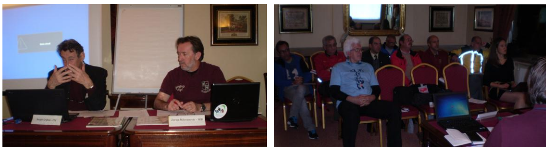
Momentos de la reunión de la Comisión Ejecutiva de la COMOF