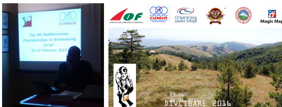
Israel y Serbia presentan sus competiciones para 2015 y 2016 respectivamente

Israel y Serbia realizan presentaciones de las dos próximas ediciones y que serán en Israel 2015 y Serbia 2016